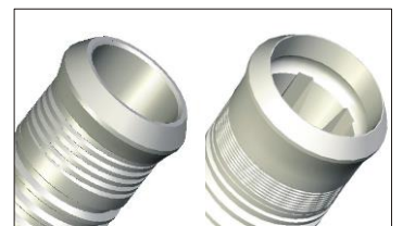
Cone Morse / Hexágono interno